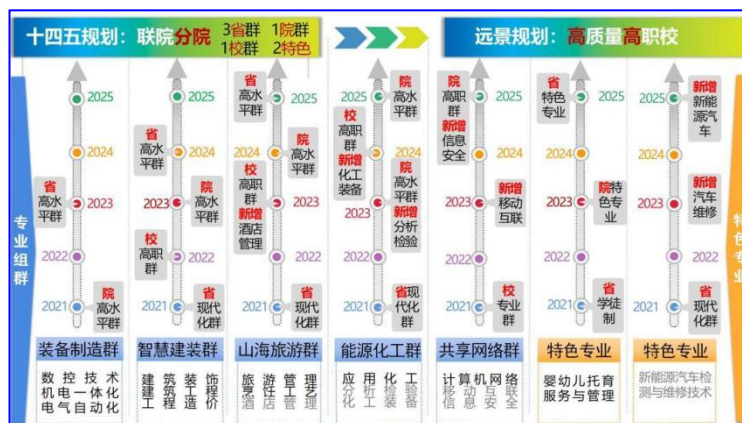
图1 学校五年制高等职业教育专业建设规划路线图

1. 深入调研、充分论证、科学定位。 紧密对接山海临港产业，强化专业委员会功能，动态调整专业结构。现有11个高职专业，围绕专业技术基础组建成机电一体化院级1个高水平专业群、建筑工程技术校级高职专业群1个，应用化工技术获评省级优质专业。