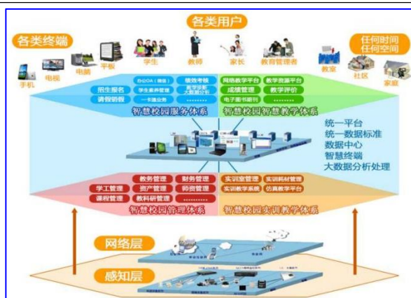
图 4 学校“ATTS”大物联网智慧化管理体系

运用智能技术构建“ATTS”管理体系，搭建大数据智慧管理平台和教诊改系统，建成了学校可视化数据中心，形成学校智能化、诊改性管理。汇聚数字资源，高效运行超星泛雅平台，自建 221 门校本网络课程，校企共建 51 门课程资源，引入 66 门课程电子教材，为师生个性化、泛在化、自主远程学习提供支撑，特别是在疫情期间为停课不停学提供了强有力支持。实施“虚拟仿真+实操”混合式教学，建成仿真机器人等 23 个专业仿真实训室、化工等 3 个交互式职业体验馆。打造智慧生活场景，实现校园“一卡联通”，建设 372 个消费、服务、管理终端，搭建“笑脸行”刷脸设备全覆盖，建成 600 余个高清监控点实现校园全覆盖，建设平安校园。教学成果《云端技术架构下基于校企合作中职“素养护照”评价体系的建设和实施》获 2021 年连云港市教学成果一等奖。